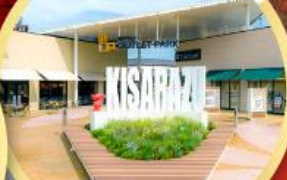
มิตซึยะ เอ้าท์เล็ต พาร์ค คิชะระชู