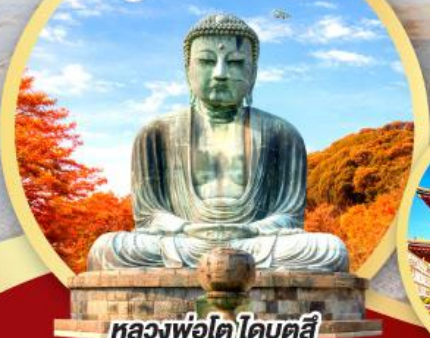
หลวงพ่อโต ไคบุตสึ