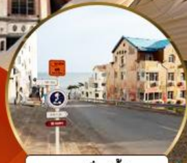
ถนนอ่าวจีป่า