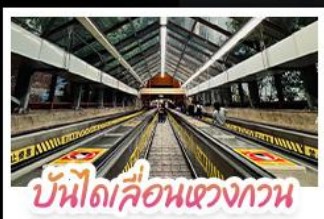
บันไดเลื่อนแขวงกวาน