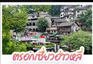
ตรอกเซียวฮ่าวเฉี