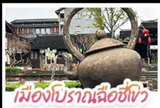
เมืองโบราณฉือซีเซว