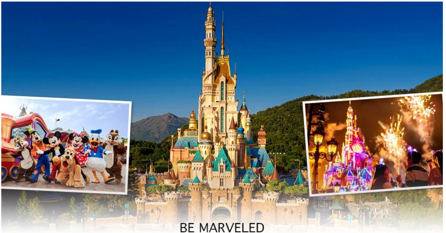
BE MARVELED HONG KONG DISNEYLAND

☺️ อาหารเช้าเที่ยงและอาหารเย็น เพื่อความสะดวกในการช้อปปิ้ง