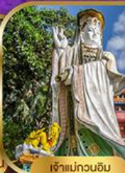
เจ้าแม่กวนอิม สวีลิสเบย์