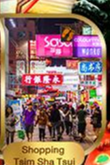
Shopping Tsim Sha Tsui