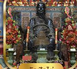
วัดปึกใต้