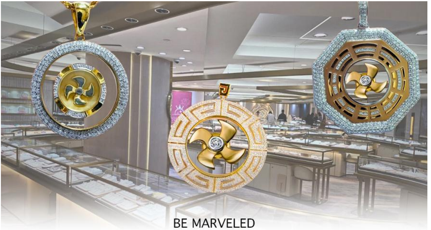
BE MARVELED ศูนย์ฮวงจู้ย กังหันเศรษฐี

นำท่านชม ศูนย์ฮวงจู้ย กังหันเศรษฐี ที่ขึ้นชื่อของฮ่องกง ท่านจะได้พบกับงานดีไซน์ที่ได้รับรางวัลยอดเยี่ยม และใช้ในการเสริมดวงเรื่องฮวงจู้ย ศูนย์ฮวงจู้ยกังหันเศรษฐี วัดเซ่งจี้ "ไม่ใช่ชื่อวัดโดยตรง แต่เป็นชื่อที่เกี่ยวข้องกับ วัดเซ่งจี้ (Che Kung Temple) ในฮ่องกง ซึ่งเป็นที่รู้จักกันดีในเรื่อง กังหันนำโชค ที่เชื่อว่าสามารถหมุนปิดเป่าสิ่งชั่วร้ายและนำโชคลาภเข้ามาในชีวิต