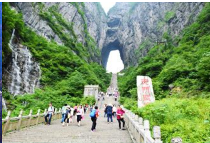
ประตูล้อมรอบ