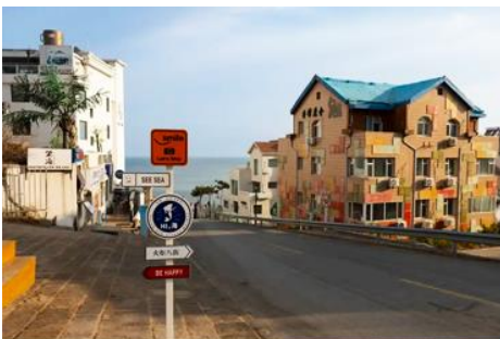
ถนนคอบเพลิงหมายเลข 8

นำท่านชมสวนสาธารณะเว่ยไห่ 威海公园 สวนสาธารณะริมทะเลที่ใหญ่ที่สุดของเมืองเว่ยไห่ ให้ท่านชมและถ่ายภาพคู่กับ กรอบรูปยักษ์วิวทะเล 威海公园大相框 แลนด์มาร์คที่เป็นอีกหนึ่งไฮไลท์ที่สุดฮิตของเว่ยไห่