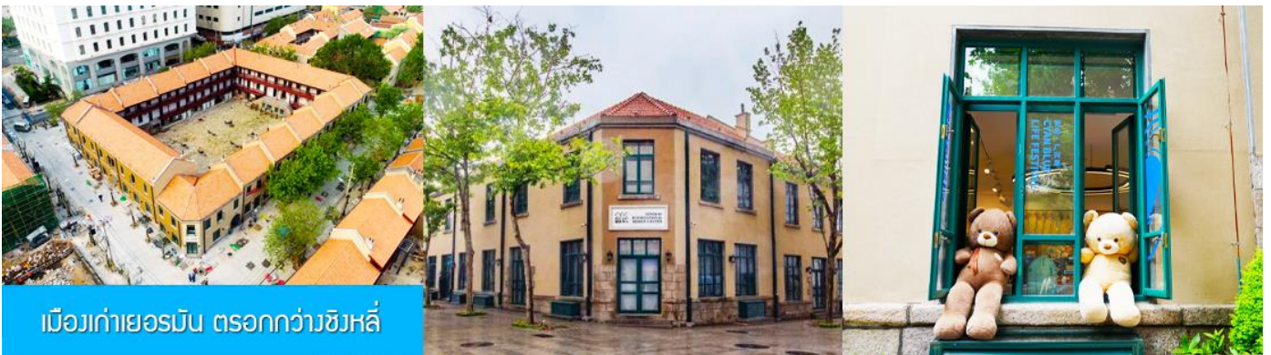
เมืองเก่าเยอรมัน ตรอกกว้างชิงหลี่

จากนั้นนำท่านเดินเที่ยวชม ถนนจงซาน 中山路 ถนนที่เต็มไปด้วยกลิ่นอายยุโรป และถนนสายนี้มีบันทึกเรื่องราวมากกว่าศตวรรษของเมืองชิงเต่าไว้ ที่นี่เป็นศูนย์กลางการค้าแห่งแรกที่เต็มไปด้วยสถาปัตยกรรมสไตล์ยุโรปเก่าแก่ที่ได้รับอิทธิพลมาจากเยอรมัน ให้ท่านได้เดินเก็บบรรยากาศ และ เก็บภาพกับ โบสถ์เซนต์ไมเคิล (ด้านนอก) โบสถ์แห่งนี้ที่คู่รักนิยมมาถ่ายภาพงานแต่งงานด้วยกันมากที่สุดในเมืองชิงเต่า ให้ท่านถ่ายรูปเก็บภาพ