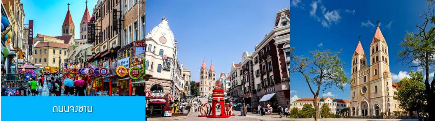
ถนนวซซาน

หลังอาหารนำท่านเดินทางชม สะพานจ้านเฉียว 栈桥 เป็นแลนด์มาร์กแห่งประวัติศาสตร์คู่เมืองชิงเต่า สร้างเมื่อปี ค.ศ.1891 มีลักษณะเป็นสะพานหินทอดยาวกว่า 440 เมตรสู่ทะเล ปลายสะพานมีศาลา ทรงแปดเหลี่ยมสีแดงที่โดดเด่น ซึ่งเป็นสัญลักษณ์บนฉลากเบียร์ชิงเต่า ขึ้นชื่อเรื่องวิวสวย รับลมทะเล ให้ท่านเก็บภาพบรรยากาศ