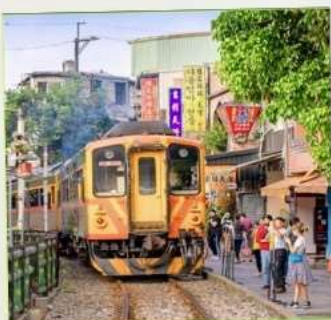
สถานีรถไฟซือเฟิ่น