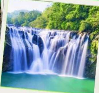
น้ำตกซือเฟิ่น