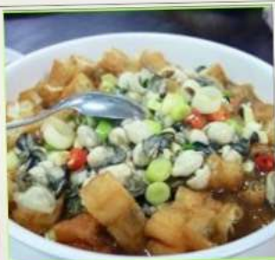
ถนนโบราณซือเฟิ่น