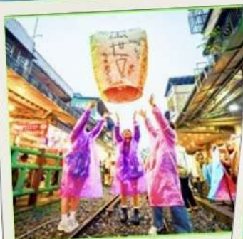
ปล่อยโคมลอย