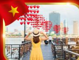
เช็กอินสะพานแห่งความรัก