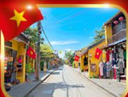
เมืองมรดกโลก ฮอยอัน