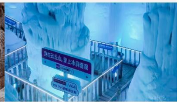
ถ้ำน้ำแข็งอวี่นชีวซาน

*ทางบริษัทฯ ขอสงวนสิทธิ์ในการสลับโปรแกรมทัวร์ตามความเหมาะสมขึ้นอยู่กับสถานการณ์หน้างาน โดยคำนึงถึงผลประโยชน์ของลูกค้าเป็นสำคัญ