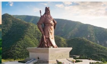
บ้านเกิดท่านกวนจู