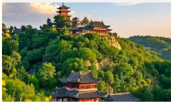
เขาเหยาหวังชาน