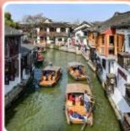
หมู่บ้านโบราณจูเจียเจียว + ล่องเรือ