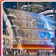
เรือหลุยส์