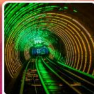
อุโมงค์เลเซอร์