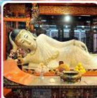
วัดพระหยกขาว