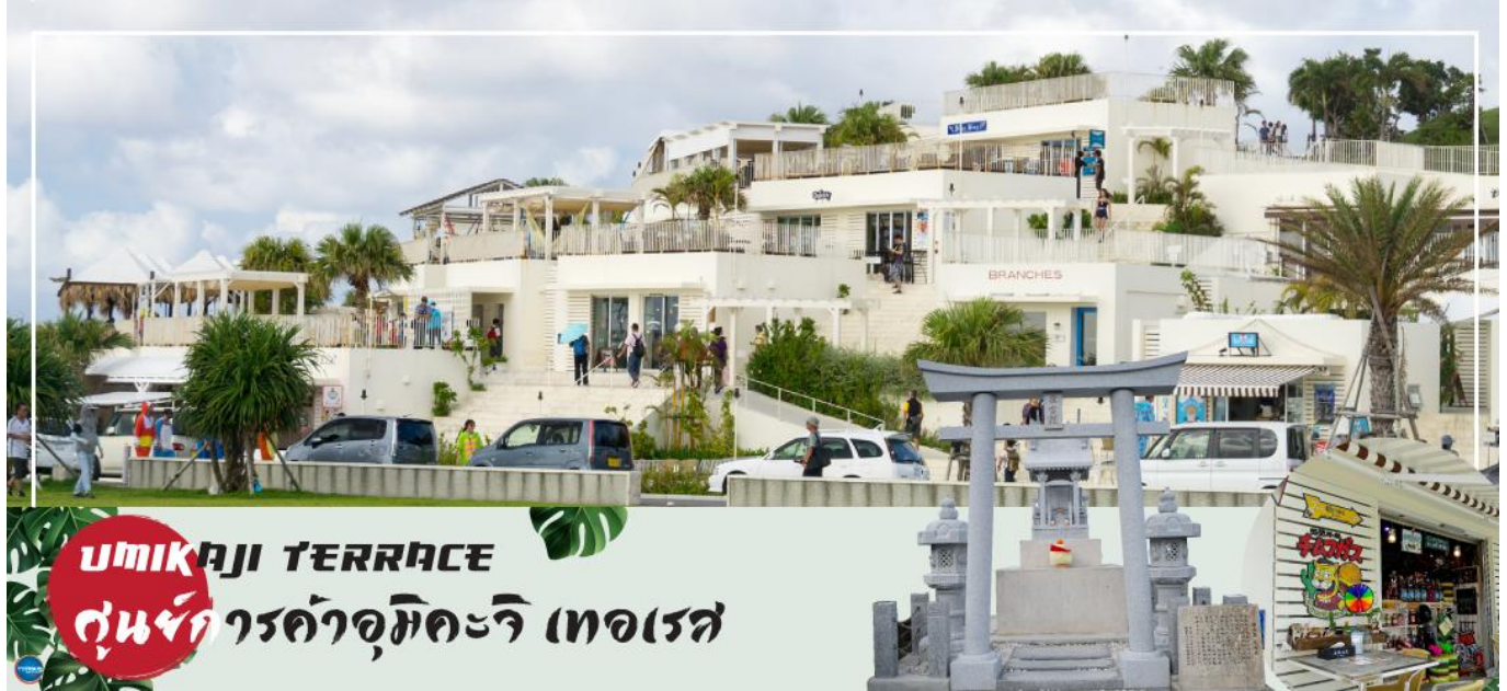
UMIKAJI TERRACE ศูนย์การค้าอุมิคะริ เทอเรซ

ที่พัก ใต้เวลาอันสมควรนำท่านเดินทางสู่โรงแรมที่พัก (ใช้เวลาเดินทางประมาณ 30 นาที) HOTEL ART STAY NAHA KOKUSAI-DORI หรือเทียบเท่า