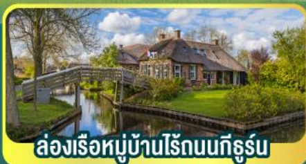
ล่องเรือหมู่บ้านไรน์บนทีกูร์น