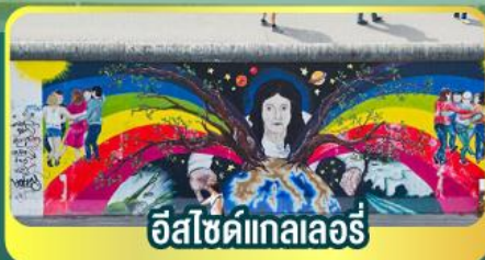
อีสไซด์แกลลอรี่