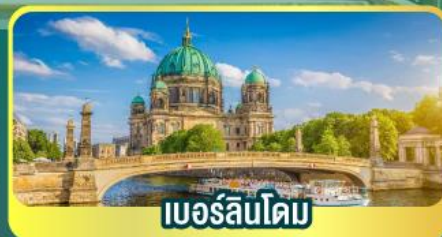
เบอร์ลินโดม