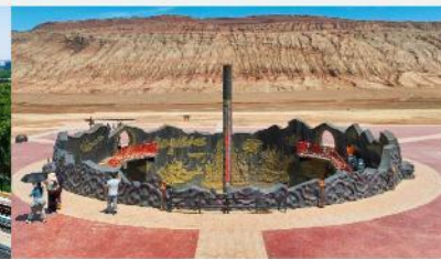
ภูเขาเปลวเพลิง

*ทางบริษัทฯ ขอสงวนสิทธิ์ในการสลับโปรแกรมทัวร์ตามความเหมาะสมขึ้นอยู่กับสถานการณ์หน้างาน โดยคำนึงถึงผลประโยชน์ของลูกค้าเป็นสำคัญ