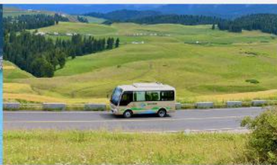
ทุ่งหญ้าเจียนปูลาเค่อ