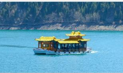
ล่องเรือทะเลสาบเกียนฉือ