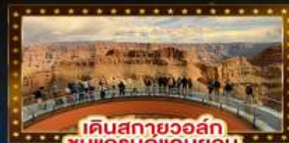
เดินสกายวอล์ก ชมแกรนด์แคนยอน