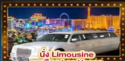
นั่ง Limousine ชมเมือง Las Vegas