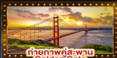
ถ่ายภาพคู่สะพาน Golden Gate