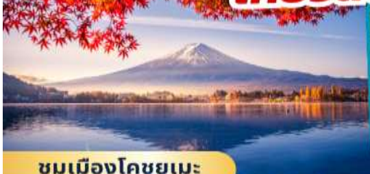
ชมเมืองโคชูยูเมะ