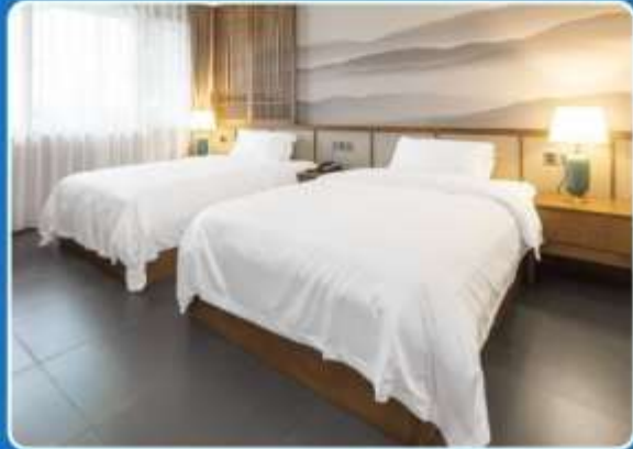
👤👤 TWIN (TWN)