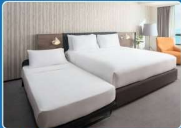
👤👤+👤 TRIPLE (TRP)

**รูปภาพห้องพักเป็นเพียงภาพสื่อถึงประเภทของเตียงเท่านั้น ไม่ใช่ภาพห้องพักจริงสำหรับการเข้าพัก**