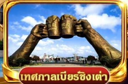
เทศกาลเบียร์ชิงเต่า