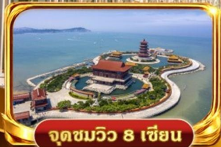
จุดชมวิว 8 เชียง