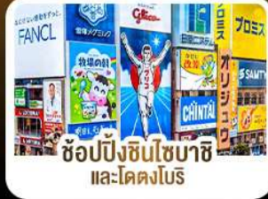
ช้อปปิ้งชินโซบาชิ และโดตงโบริ