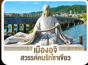
เมืองอจิ สวรรค์คนรักชาเขียว