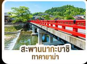
สะพานนากะบาชิ ทาคายาม่า