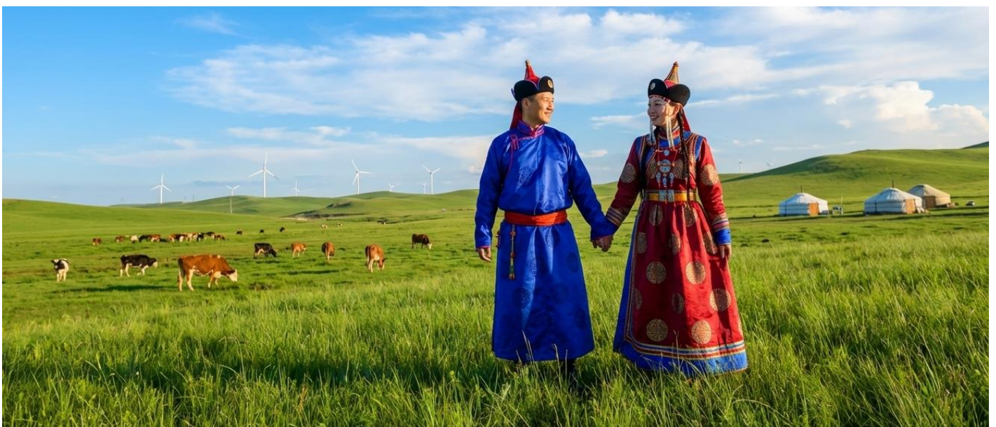
บ่าย นำท่านเข้าร่วมกิจกรรม สวมชุดแบบมองไกล สัมผัสพลังแห่งบรรพบุรุษ สวมเสื้อคลุมแบบดั้งเดิมที่มีสีสันสดใส ปักลวดลายอันประณีต คุณจะสัมผัสได้ถึงพลังแห่งบรรพบุรุษที่เคยปกครองดินแดนครึ่งโลก การสวม