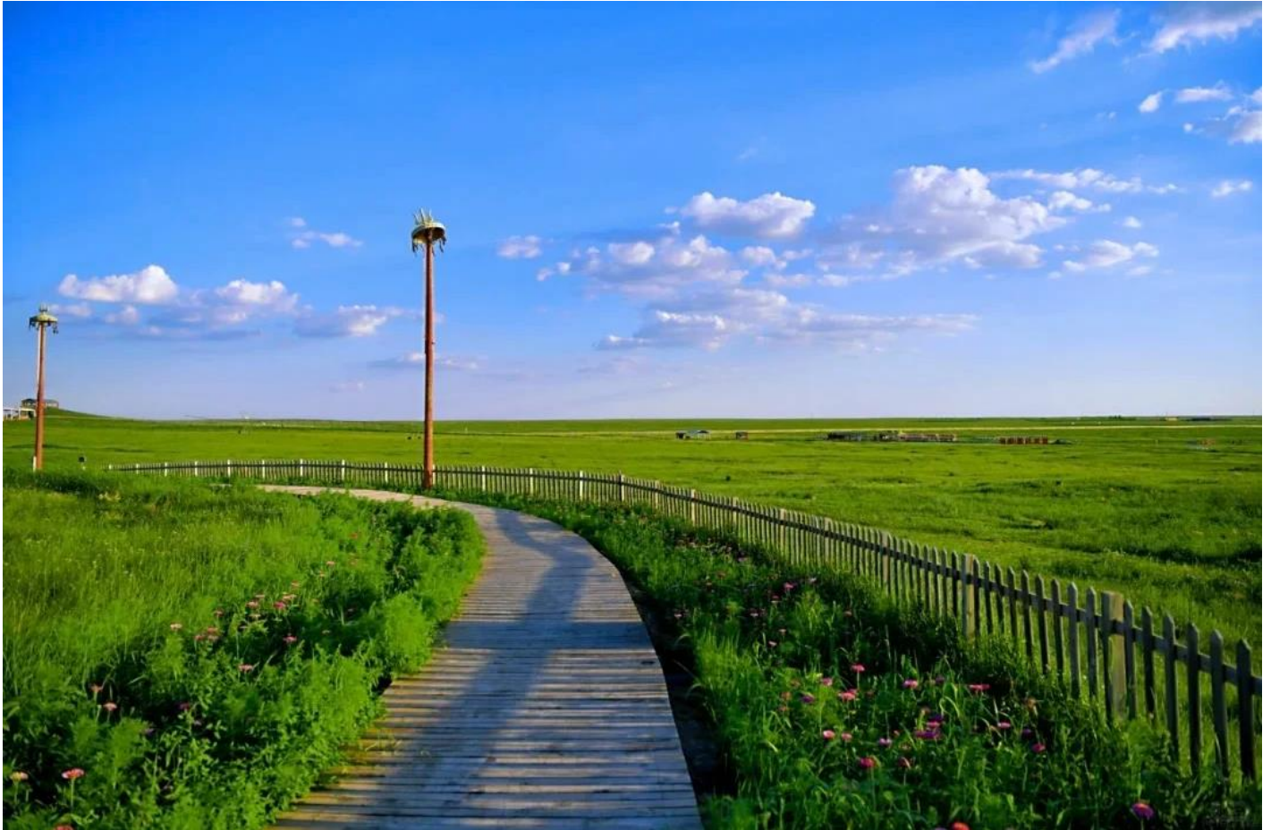
กลางวัน รับประทานอาหารกลางวัน ณ ภัตตาคาร (มือที่ 2)

ตั้งอยู่ท่ามกลางเนินเขาลูกคลื่นที่เป็นไปหลายสิบล้านไมล์ ราวกับผืนผ้าเขียวขจีที่ไม่มีที่สิ้นสุด การจัดวางเต็นท์มองไกล 399 หลังรอบๆ เต็นท์ทองคำหลวง 2 หลัง สร้างผังแบบ "นกอินทรีกางปีก" ที่สวยงามและสมมาตร ภูมิอากาศที่แห้งแล้งสร้างท้องฟ้าใสราวกับใบหน้าของเทพเจ้า ทำให้ทุกช่วงเวลาที่นี่เต็มไปด้วยแสงแดด อุ่นอบอุ่นและลมเซาะๆ ที่พัดผ่านใบหญ้าอย่างอ่อนโยน กิจกรรมต่างๆ ที่นี้จะทำให้ท่านได้สัมผัสทั้งความตื่นเต้นและความสงบ