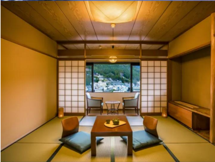
Standard Japanese-style Room 49.5m