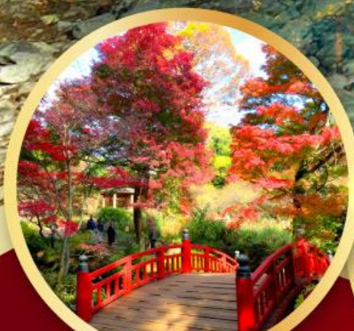
สวนดอกบ๊วยอาคามิ