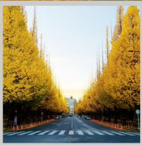
"ICHONAMIKI GINGO AVENUE"