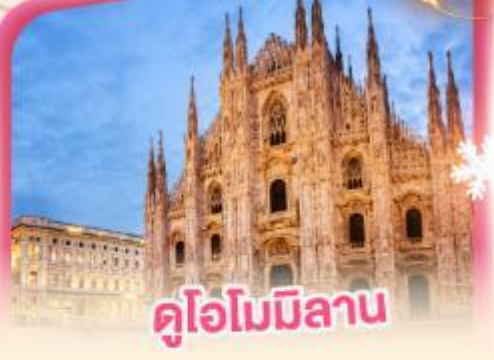
คู่อิมมิลาน