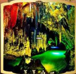
ถ้ำน้ำเป็นซี