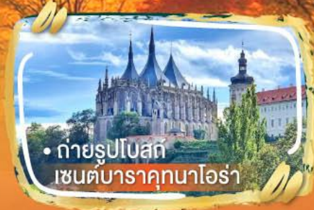
• ถ่ายรูปโบสถ์ เซนต์บาราคุกนาโอรา