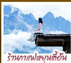
ร้านอาหารเขย่าต้นอัน

ชมวิวภูเขาหิมะสวยที่สุด โรแมนติกกับแสงยามพลบค่ำ เที่ยวเมืองโบราณต้าหลี่ ลี้เจียง ป๋อซา แซงกรี่ล่า ชมวิถีชีวิตของชนชนยูนนานและทิเบต พิสูจน์ความกล้าท้าเดินชมสะพานแก้วลี้เจียง • ซุปโปงเพลินที่ถนนคนเดินหนานผิงเจียง