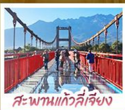
สะพานแก้วลี้เจียง