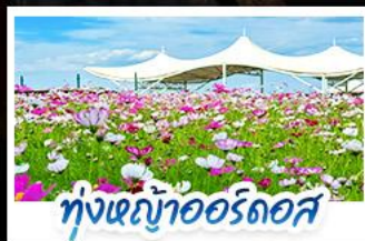
ทุ่งหญ้าเออร์โดส