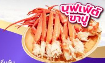
บุฟเฟ่ต์ 3 อย่าง