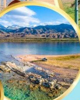
ล่องเรือทะเลสาบอิสซิค