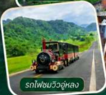
รถไฟชมวิวอู่หลง