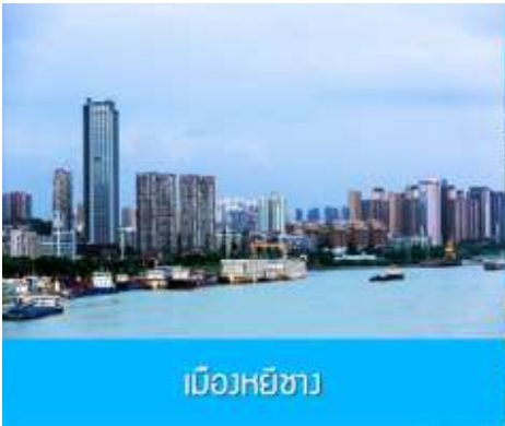
เมืองหยี่ชาง