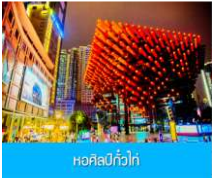
หอศิลป์กั๋วไท่