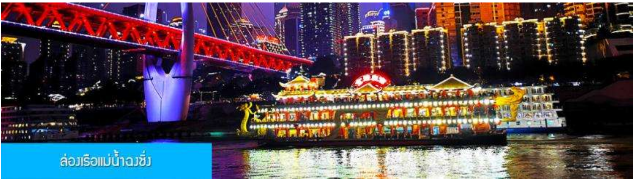
ล่องเรือแม่น้ำจิวชิ่ง