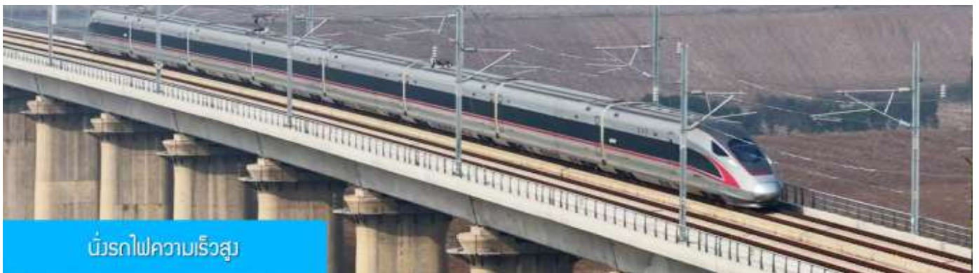
บัวร์รถไฟความเร็วสูง

หลังอาหารนำท่านเดินทางสู่สถานีรถไฟความเร็วสูงเมืองฮี้ซัง เพื่อเตรียมขึ้นรถไฟไปเมืองฉงชิ่ง