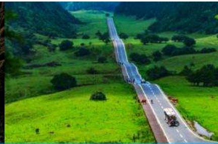
อุทยานเขาเนวฟ้า