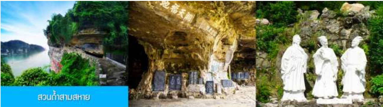
สวนกำสามสหาย