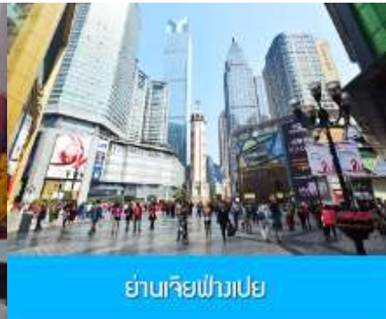
ย่านเจียฟางเปย