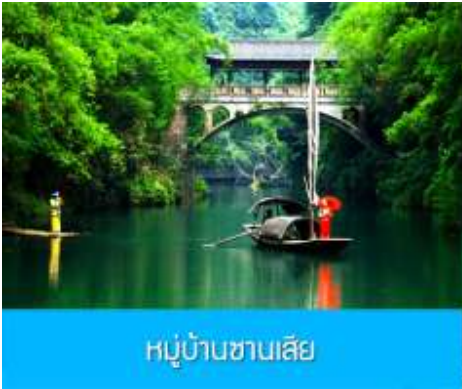
หมู่บ้านชานเสี

23.35 น. เดินทางถึง สนามบินนานาชาติ เมืองหยี่ชาง ผ่านพิธีการตรวจคนเข้าเมืองและศุลกากร นำคณะเดินทางเข้าสู่โรงแรมที่พัก พักที่ YICHANG HUIHAO HOTEL โรงแรมระดับ 4 ดาวหรือเทียบเท่าในเมืองหยี่ชาง