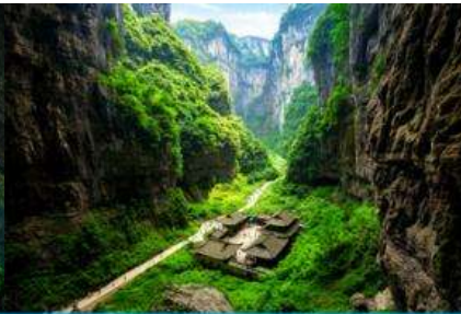
สะพานธรรมชาติสามแห่ง