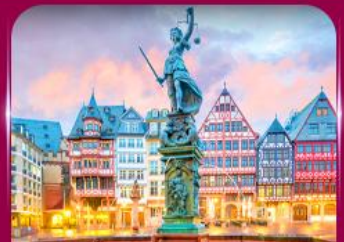
จัตุรัสโรเมอร์ ปรากท์เพิร์ต