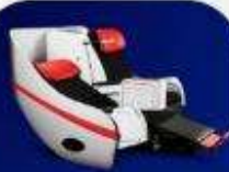
ที่นั่งพรีเมียมแฟลตทอป

บริการอาหารร้อน และ น้ำดื่ม บนเครื่องบิน ขาไป และ ขากลับ