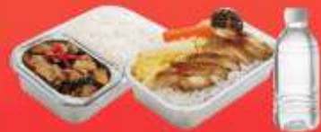
บริการอาหารร้อนบนเครื่อง ชาไป - ชากลับ