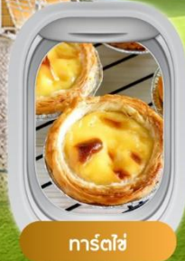
ทาร์ตไข่