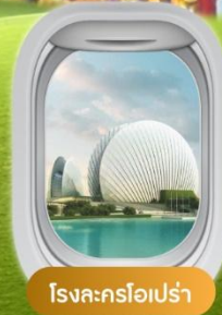
โรงละครโอเปร่า