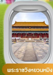
พระราชวังหยวนหมิง