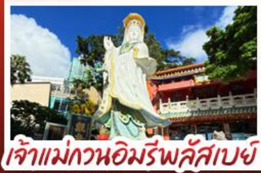
เจ้าแม่กวนอิมรัฟัสเบย์