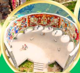
Russian-Georgian Friendship Monument