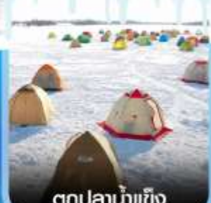
ตกปลาน้ำแข็ง