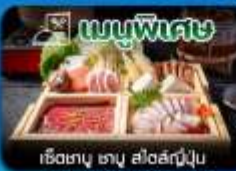
เชิ๊งทานู ทานู สโงสึบุงุ