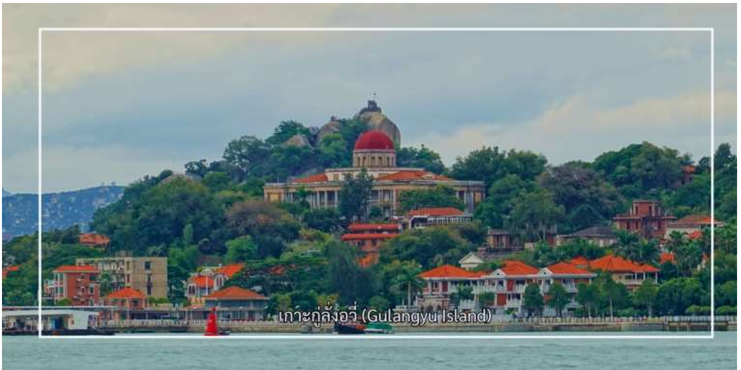
เกาะกู่ลิ่งอวี่ (Gulangyu Island)

สัมผัสกลิ่นไอความคลาสสิกกับ กลุ่มอาคาร Wanguo บนเกาะกู่ลิ่งอวี่ ซึ่งเป็นกลุ่มสถาปัตยกรรมที่สะท้อนอิทธิพลตะวันตกจากหลายประเทศในอดีต อาคารแต่ละหลังมีรูปแบบแตกต่างกัน ทั้งสไตล์ยุโรปคลาสสิก โคโลเนียล และนีโอคลาสสิก จนได้รับสมญานามว่า “พิพิธภัณฑ์สถาปัตยกรรมนานาชาติ” และเดินเล่น ถนนการค้า Longtou เป็นถนนสายอาหารและแหล่งช้อปปิ้งยอดนิยมบนเกาะกู่ลิ่งอวี่ (Gulangyu) ที่คึกคักและเต็มไปด้วยสีสัน พร้อมเพลิดเพลินกับบรรยากาศการเดินเล่นบนถนนสายหลักที่สะท้อนวิถีชีวิตและเสน่ห์ของกู่ลิ่งอวี่ จากนั้นนำท่านแวะถ่ายรูปเช็คอินบริเวณ หาดทรายหลังท่าเรือ เพลิดเพลินกับบรรยากาศริมทะเลและทัศนียภาพอันสวยงาม เหมาะแก่การเก็บภาพความประทับใจเป็นที่ระลึก