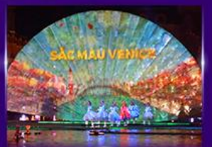
Sac Mau Venice Show