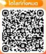
ไฮไลท์ทั้งหมด