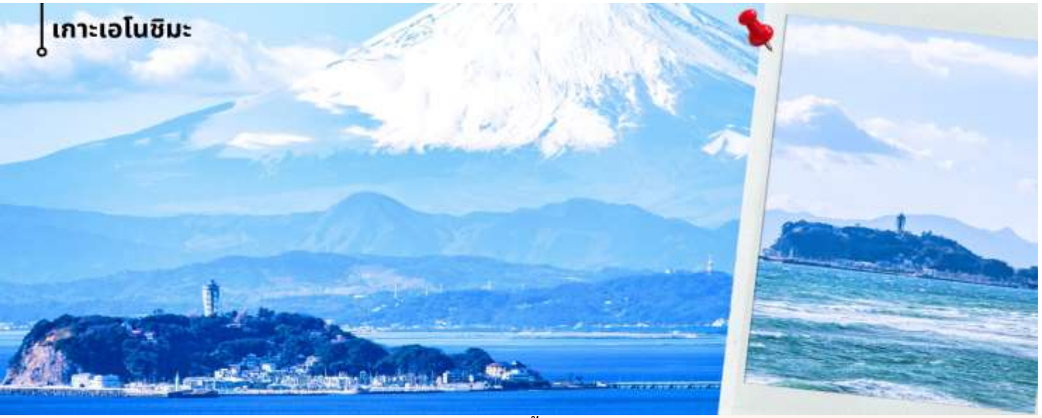
** การมองเห็นฟูเขาไฟฟูจิขึ้นอยู่กับสภาพอากาศ **