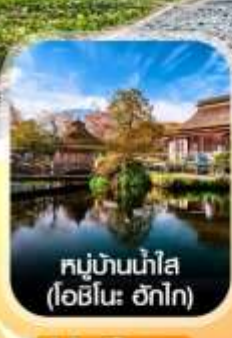
หมู่บ้านน้ำใส (โอะชิโนะ ฮักโก)