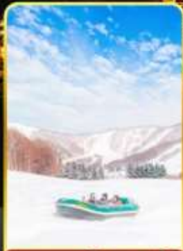
กิจกรรมสโนว์ราฟติง