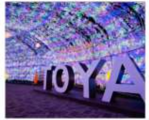
จูมอนด์ไฟโทยะ