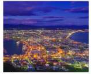
นังกระเช้าฮาโกดาเตะ