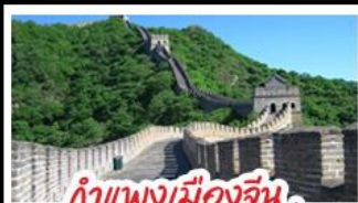
กำแพงเมืองจีน ด่านมู่เทียนยวี่

Universal Beijing - กำแพงเมืองจีนด่านมู่เทียนยวี่ (รวมกระเช้าขึ้น-ลง) พระราชวังโบราณกู้กง - หอฟ้าเทียนถาน - ซุปป์ิงถนนหวิงฟูจิ่ง และซานหลี่กุน เมนูพิเศษ สุกี่มองโก, เป็ดปักกิ่ง, Michelin Guide ร้าน Tao Tao Ju