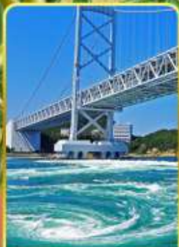
ช่องแคบนารุโตะ