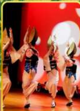
อะวะ โอะโตะริ โคคัง