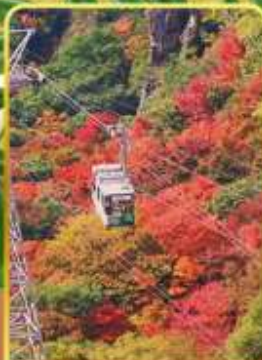
กระเช้าหุบเขาคังคาเคอิ