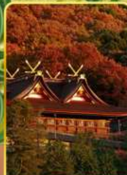
ศาลเจ้าคิมิฮิโระโกะ

ออนเซ็น 4 คั้น นน.กระเป๋า 23 กก.X2 8Days 5Night