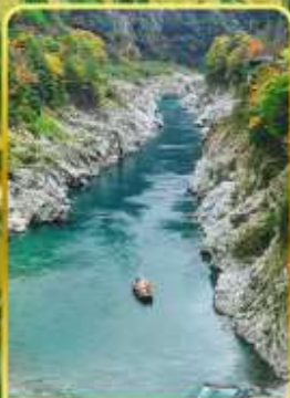
ส่องเรือช่องเขาโอบิเคะ