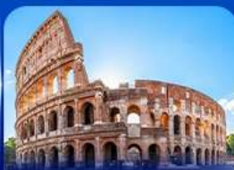
เข็ควินดัง โคลอสเซียม โรม