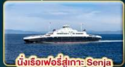
นั่งเรือเฟอร์รี่สู่เกาะ Senja