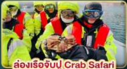
ล่องเรือจับปู Crab Safari

เยือนเมืองหลวงแห่งแสงเหนือ สัมผัสความสวยงามของนอร์เวย์ที่แท้จริง