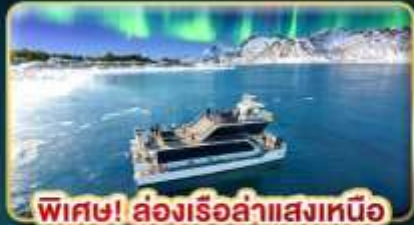
พิเศษ! ล่องเรือลำแสงเหนือ