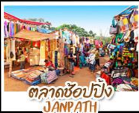
ตลาดช้อปปิ้ง JANPATH