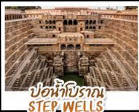
บ่อน้ำโบราณ STEP WELLS

เยือน Taj Mahal 1 ใน 7 สิ่งมหัศจรรย์ของโลก บ่อน้ำโบราณ Step wells - ประตูของ City Palace ตลาดช้อปปิ้ง Janpath - พระราชสาลม Hawa Mahal