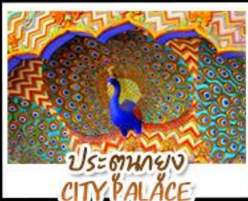
ประตูของ CITY PALACE