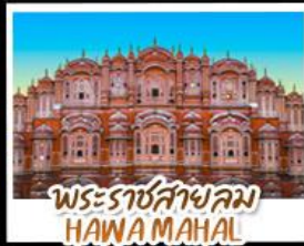
พระราชสาลม HAWA MAHAL