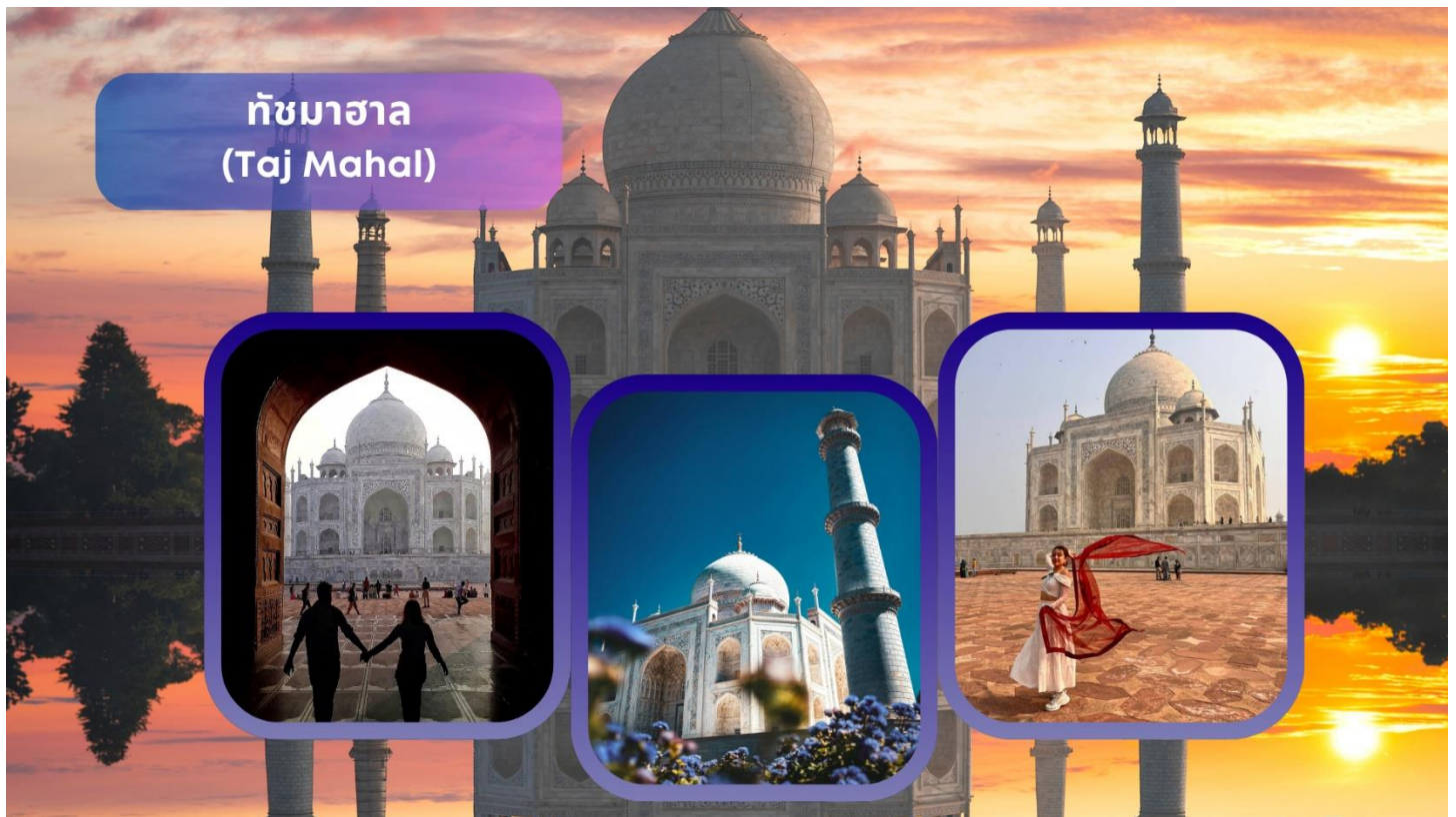
ทัชมาฮาล (Taj Mahal)

เข้าชมด้านใน ทัชมาฮาล (Taj Mahal) แหล่งมรดกโลกและเป็น 1 ใน 7 สิ่งมหัศจรรย์ที่สำคัญของโลก นำท่านเดินสู่ประตูสุสานที่สลักตัวหนังสือภาษาอาระบิกที่เป็นถ้อยคำอุทิศและอาลัยต่อบุคคลอันเป็นที่รักที่จากไปอนุสรณ์สถานแห่งความรักอันยิ่งใหญ่และอมตะของพระเจ้าชาห์จาฮันที่มีต่อพระนางมุมตซ์ โดยสร้างขึ้นในปี ค.ศ. 1631 และนำท่านถ่ายรูปกับลานน้ำพุที่มีอาคารทัชมาฮาลอยู่เบื้องหลัง แล้วนำท่านเข้าสู่ตัวอาคารที่สร้างจากหินอ่อนสีขาวบริสุทธิ์ที่ประดับลวดลายด้วยเทคนิคฝังหินสีต่างๆ ลงไปในเนื้อหิน สถาปัตยกรรมชิ้นเอกของโลกที่ออกแบบโดยช่างจากเปอร์เซีย โดยอาคารตรงกลางจะเป็นรูปโดมซึ่งมีหอคอยสี่เสาล้อมรอบ ตรงกลางด้านในเป็นที่ฝังพระศพของพระนางมุมตซ์ มาฮาล และ พระเจ้าชาห์จาฮัน ได้อยู่คู่เคียงกันตลอดชั่วชีวิต ทัชมาฮาลแห่งนี้ใช้เวลาก่อสร้างทั้งหมด 22 ปี โดยสิ้นเงินไป 41 ล้านรูปี มีการใช้ทองคำประดับตกแต่งส่วนต่างๆ ของอาคารหนัก 500 กิโลกรัม และใช้คนงานกว่า 20,000 คน ต่อมานำท่านเดินอ้อมไปด้านหลังที่ติดกับแม่น้ำยมนาโดยฝั่งตรงกันข้ามจะมีพื้นที่ขนาดใหญ่ถูกปรับดินแล้ว โดยเล่ากันว่าพระเจ้าชาห์จาฮันเตรียมที่จะสร้างสุสานของตัวเองเป็นหินอ่อนสีดำโดยตัวรูปอาคารจะเป็นแบบเดียวกันกับทัชมาฮาล เพื่อที่จะอยู่เคียงข้างกัน แต่ถูกออรังเซบ ยึดอำนาจและนำตัวไปคุมขังไว้ในป้อมอัคราเสียก่อน **เนื่องจากทัชมาฮาลปิดทุกวันศุกร์ กรณีที่เข้าทัชมาฮาลตรงกับวันศุกร์ ทางบริษัทขอสงวนสิทธิ์สลับโปรแกรมเที่ยวตามความเหมาะสม**