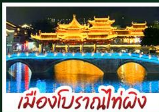
เมืองโบราณไท่ผิง