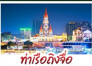
ท่าเรือกิ่งจื่อ

เขาชิงช้าสวนดอกไม้ตามฤดูกาล หมู่บ้านสไตล์ยุโรปเที่ยงยวี่ มังซิง เสี่ยวเจิน ถนนคนเดิน NANNING ZHIYE - เมืองโบราณไท่ผิง ท่าเรือกิ่งจื่อ - ถนนคนเดิน สามตรอกสองซอย