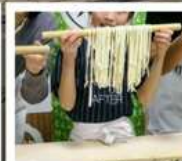
กิจกรรมทำเส้นอุด้ง