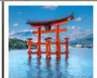
ศาลเจ้าอิตสึคุชิมะ