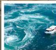
คลองเรือชมน้ำวนมารุโตะ

วัดบึงฮอน / ตลาดกิงงะ / โบสถ์โทกาวานี่ (จุดชมวิว) / สะพานคินไตเคียว เกาะมียาจิมา ศาลเจ้าอิตสึคุชิมะ / สวนอนุสรณ์สันติภาพฮิโรชิมา โดโกะออนเซ็น / ถนนโอโมเตะซันโด คมปีระซัง / ปราสาทมัตสึยาม่า กิจกรรมทำเส้นอุด้ง / สวนริทสึริน / สถานีรับทางคุรุคุรุมารุโตะ คลองเรือชมน้ำวนมารุโตะ / ซุปบึงย่านชินโซบาชิ / ตลาดปลาคุโรมง / ซุปบึงย่านอุมาเดะ