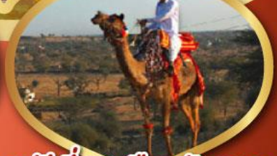
ฟรี ขี่อูฐ เมืองมันทอวา ราคาเริ่มต้น